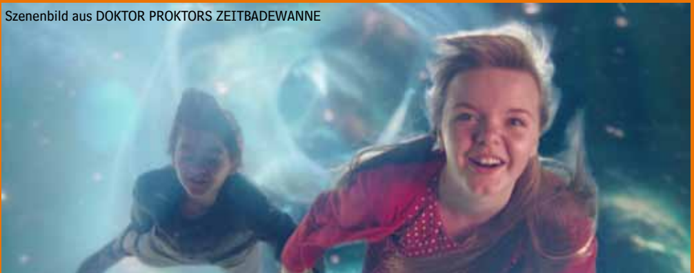
Szenenbild aus DOKTOR PROKTORS ZEITBADEWANNE

Das Kommunale Kino Esslingen wird gefördert von der Stadt Esslingen am Neckar und der MFG-Filmförderung Baden-Württemberg.